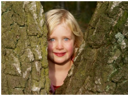
Unser NaturForscher-Projekt bringt Stadtkinder in die Natur

In den Naturschutz-Zentren der Stiftung in Fischbek und Boberg gibt es seit einigen Jahren ein besonderes Angebot. Gruppen aus Kitas, Vorschulen oder Grundschulen können sich als NaturForscher anmelden. Sie erkunden dann ein Jahr lang an zehn Vormittagen mit geschulten Fachkräften der Stiftung die Natur. Die Stiftung will mit diesem Projekt dazu beitragen, dass die Kinder wichtige Erfahrungen in der Natur sammeln können. Das freie Spiel draußen, das Umherschweifen in der Landschaft, die vielen Entdeckungen, die sie in der Natur machen