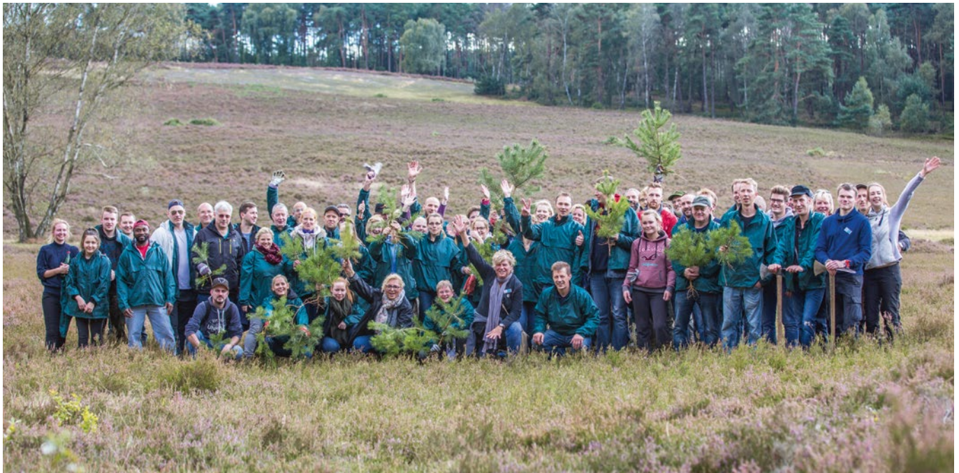
80 Mitarbeiter der Firma Bacardi beim Einsatz für die Natur in der Fischbeker Heide

Erinnern Sie sich? Das Jahr 2017 stand ganz im Zeichen des Klatschmohns, der Blume des Jahres. Mit ihr warben wir für den Erhalt und die Aussaat von bedrohten Ackerwildkräutern.