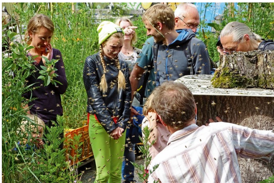
StadtNatur mal anders: Bienen auf dem Gartendeck St. Pauli beim Langer Tag der StadtNatur 2017

Der Lange Tag der StadtNatur wird seit 2011 von der Loki Schmidt Stiftung organisiert und ist Hamburgs größtes Natur-Event. Für das Jahr 2018 wird die Elbe als die Region verbindende Lebensader einen besonderen Schwerpunkt bilden. Am Wochenende 16./17. Juni 2018 werden zahlreiche Veranstaltungen zwischen dem Wendland und der Elbmündung den vernetzenden Charakter dieses Flusssystemes und seine Bedeutung für die Metropolregion Hamburg verdeutlichen.