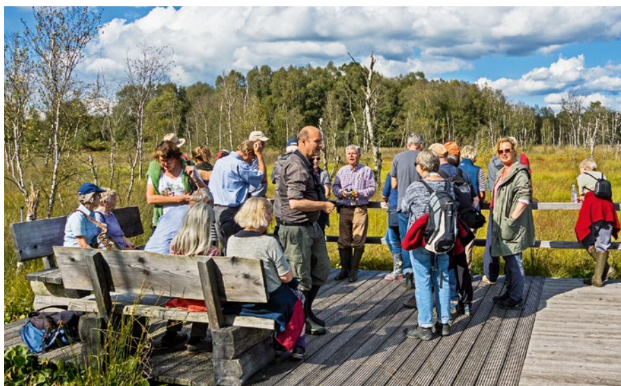
Der Freundeskreis der Loki Schmidt Stiftung im Dosenmoor