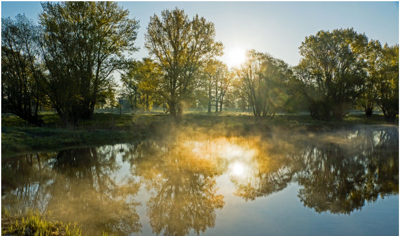
Morgenstimmung in der Elbtalaue

Naturnahe Flussauen sind die artenreichsten Lebensräume Mitteleuropas. Einst bedeckten sie großflächig die Urstromtäler unserer Flüsse. Mittlerweile sind auch an der Elbe nur noch kleine Restbestände vorhanden.