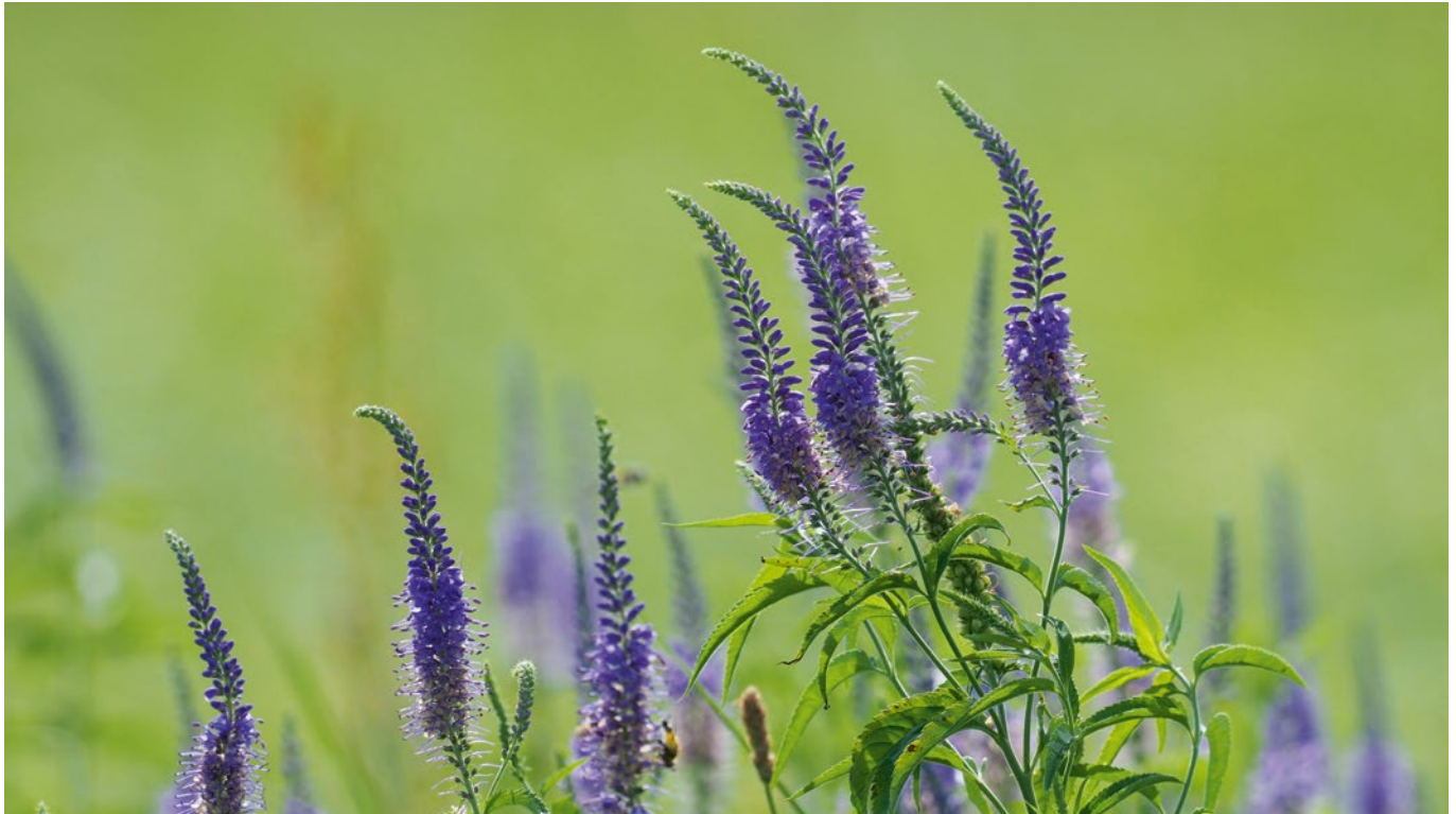
Ein Bewohner der Flussaue: Der Langblättrige Ehrenpreis

Mit der Kür des Langblättrigen Ehrenpreises zur 39. Blume des Jahres seit 1980 macht die Loki Schmidt Stiftung nicht nur auf die Gefährdung dieser einen Art aufmerksam, sondern rückt auch ihren Lebensraum ins Licht der Öffentlichkeit. Denn die diesjährige Blume des Jahres ist nicht nur eine besonders schöne, bundesweit gefährdete heimische Wildpflanze, sie lebt auch in einem ganz besonderen, europaweit stark bedrohten Ökosystem, der naturnahen Flussaue. Ihm widmet die Stiftung zusammen mit ihren Partnern ein ganz besonderes Projekt (siehe Artikel auf Seite 3).