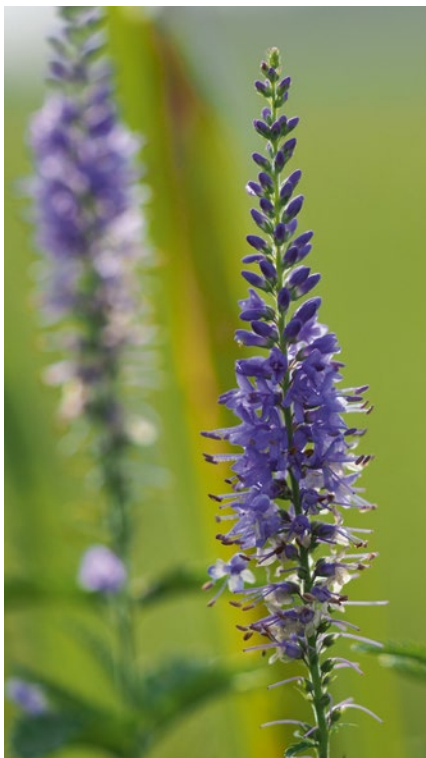
Den Langblättrigen Ehrenpreis und die Elbtalauen mit der Loki Schmidt Stiftung erleben

Auch 2018 wird es wieder verschiedene Führungen und Tagungen zur Blume des Jahres 2018 geben. Zur Zeit sind mehrere Veranstaltungen in Hamburg, Niedersachsen, Mecklenburg-Vorpommern und Schleswig-Holstein in Vorbereitung. Auch für die Mitglieder des Freundeskreises der Loki Schmidt Stiftung wird eine besondere Fahrt angeboten.