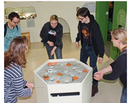
Interaktiv, anregend, lehrreich, lustig – die neue Boberger Ausstellung

Schon jetzt steht fest: Die neue Ausstellung wird gut angenommen. Kommen Sie ins Dünenhaus und überzeugen Sie sich selbst. Wir freuen uns auf Sie!