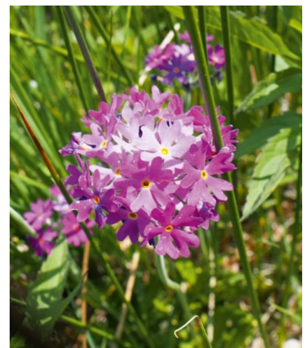
Die Mehlprimel auf dem Binsenberg – Schönheit und Rarität