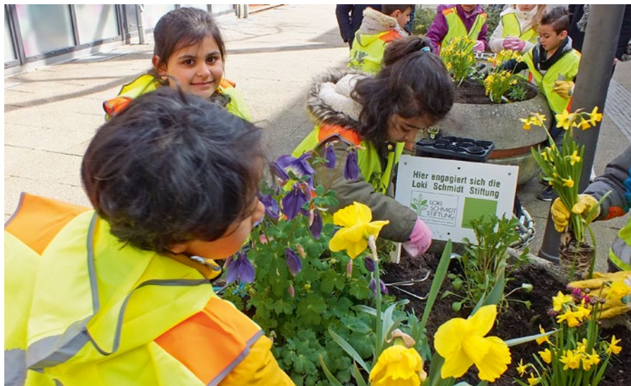
Aktiv für ein grünes Neugraben: Die Loki Schmidt Stiftung und ihre Helfer von der Internationalen Vorbereitungsklasse der Schule Neugraben

Mit dem Projekt „Grüne Inseln für Neugraben“ möchte die Loki Schmidt Stiftung unsere kleinen und großen Bürger an die Natur heranführen, besonders an die Pflan-