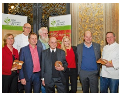
Dank an die Bio-Bäckereien Effenberger und Springer