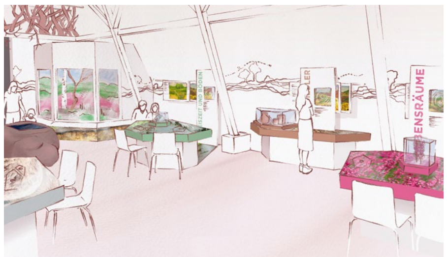
Entwurf für die neue Ausstellung in Fischbek / Illustration: Sarah Mählen, mgp ErlebnisRaumDesign GmbH

Da die Fischbeker Heide über die Landesgrenzen hinaus bedeutend ist, soll die neue Ausstellung das Thema der Heidelandschaften und ihrer Geschichte im norddeutschen Umfeld abbilden. An verschiedenen, als Tisch gestalteten Stationen werden die Besucher sich künftig über Themen wie die Landschaft, ihre Entstehung, Pflanzen und Tiere und die verschiedenen Lebensräume informieren können. Das Vorhaben wird gefördert durch die Metropolregion Hamburg, die Claus &