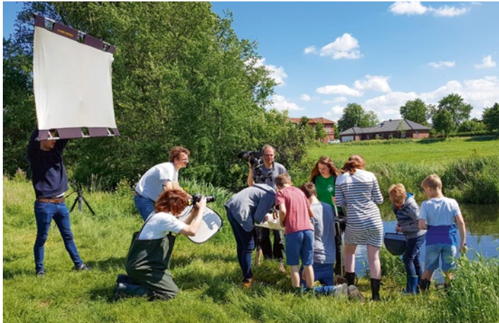
Bei den Dreharbeiten

Einen Film über die Stiftung zu drehen, der unsere Arbeit in starken Bildern auf den Punkt bringt und der nicht länger als 80 Sekunden sein darf, das war die Aufgabe, vor der das Team der Stiftung und Filmemacher Christoph Siegart standen, als sie sich an einem Wettbewerb beteiligen wollten.