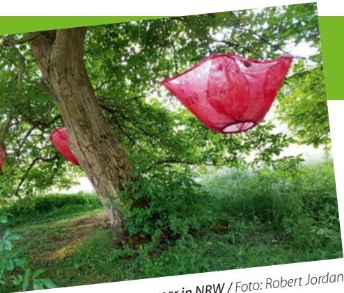
Kultursommer in NRW

konnte eine unglaublich große Fläche bearbeitet werden. Toll!