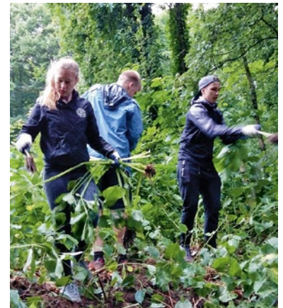
Schüler des Lise-Meitner-Gymnasiums im Naturschutzeinsatz

Unter dem Titel „Die Natur braucht Dich“ konnten in den letzten beiden Jahren 80 Biotoppflegeeinsätze in Hamburger Naturschutzgebieten mit Schulklassen aus den unterschiedlichsten Stadtteilen durchgeführt werden. Im Vordergrund stand dabei das Entkusseln, die Entfernung junger Bäume aus Heide- und Moorgebieten, aber es wurden auch Amphibiengewässer angelegt, Zäune gebaut, gemäht und gepflanzt. Zusätzlich zu den Einsätzen wurden entsprechende Lehrerfortbildungen vom Landesinstitut für Lehrerbildung durchgeführt.